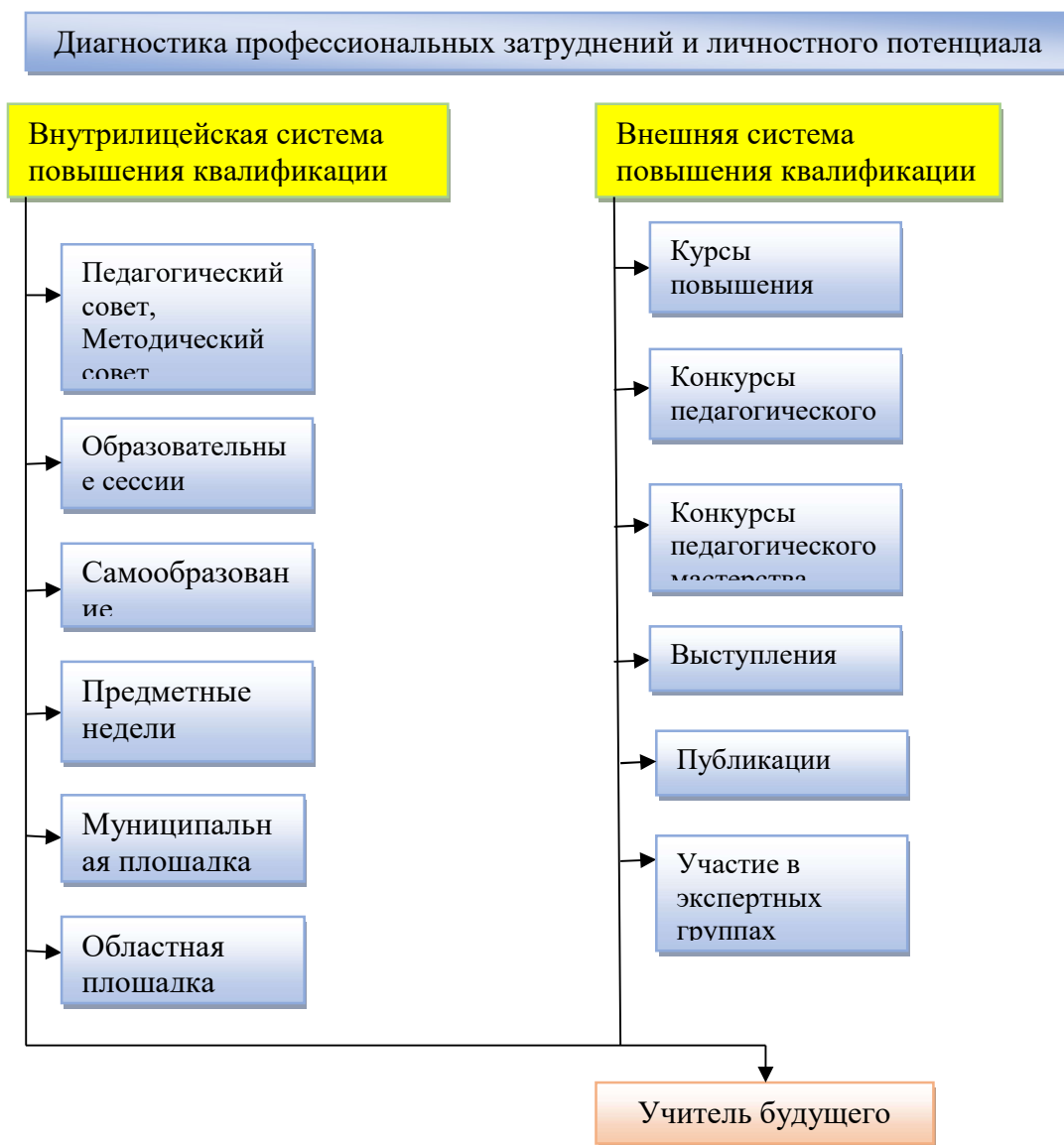
Схема Подпрограммы «Учитель будущего»