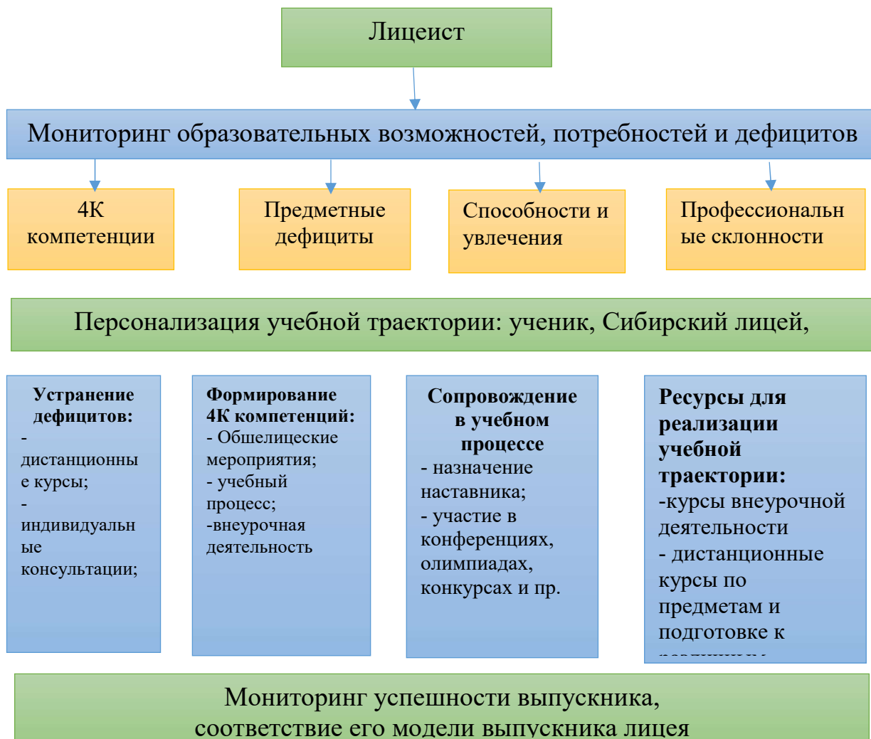
Схема Подпрограммы «Успех каждого лицеиста»

Культурологический подход который позволяет определить основные способы решения проблем при работе с детьми, осуществлять планирование и прогнозирование их деятельности.